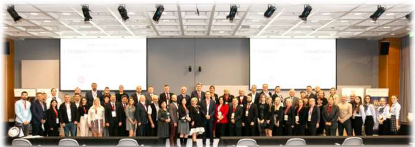
Laureati nagrada i priznanja GLOBALLOCAL za 2020. godinu, Hrvatska, Dubrovnik, „Adriatic luxury hotels - Palace“, 21. - 24. 10. 2021.