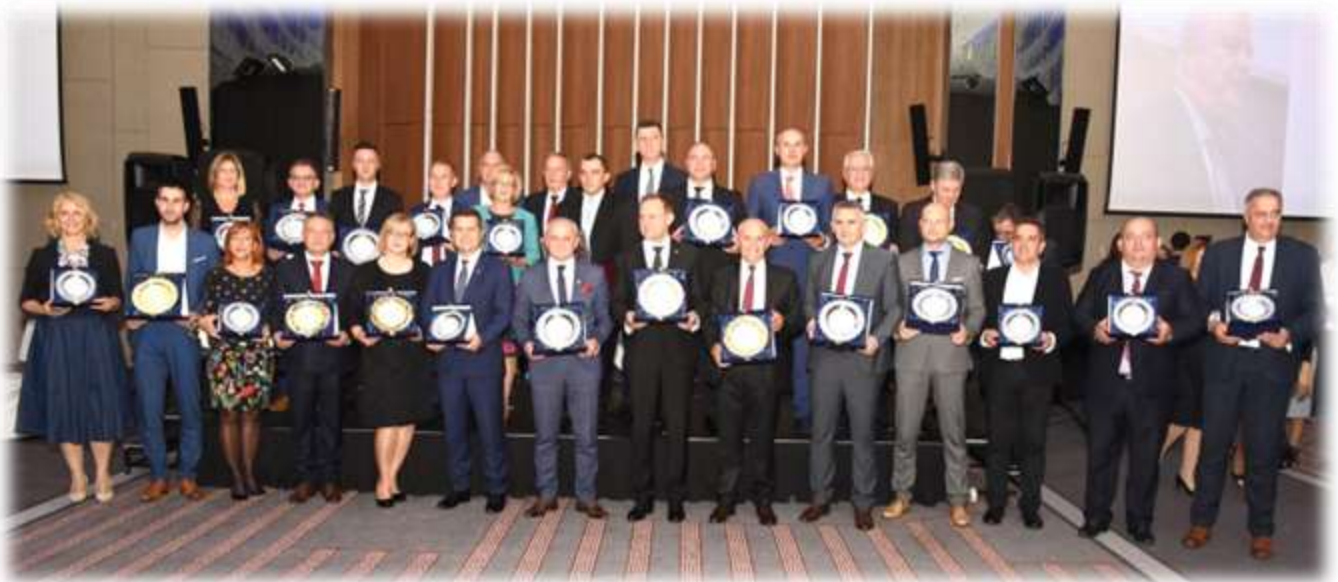
Laureati nagrada i priznanja GLOBALLOCAL za 2018./2019. godinu, Sjeverna Makedonija, Skoplje, Hotel „Marriott“, 16. - 19. 10. 2019.

Local Entrepreneurship for Global Development Global Entrepreneurship for Local Development