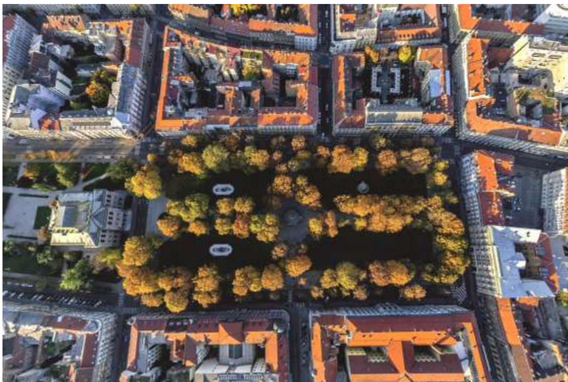
Fotografija „Zagreb“

– PLAN I STRATEGIJA REALIZACIJE PROJEKTA –